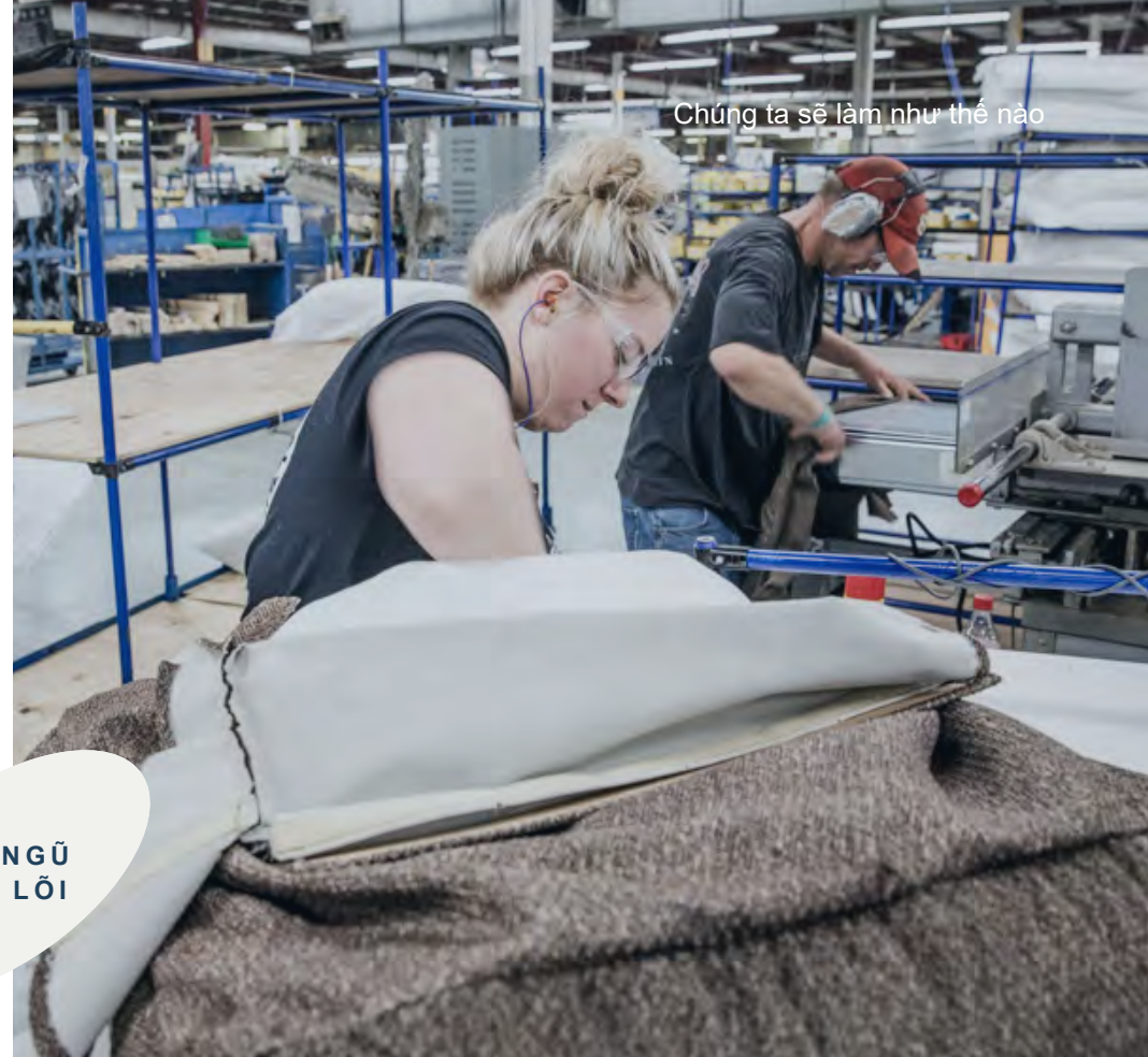
Chúng ta sẽ làm như thế nào