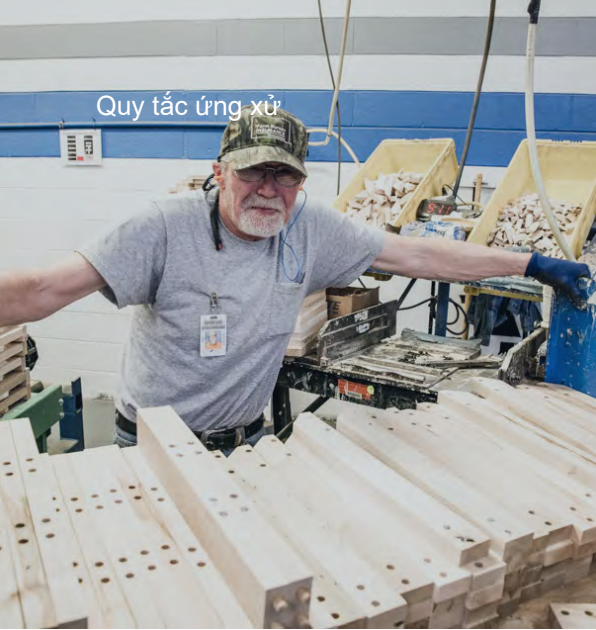
Quy tắc ứng xử